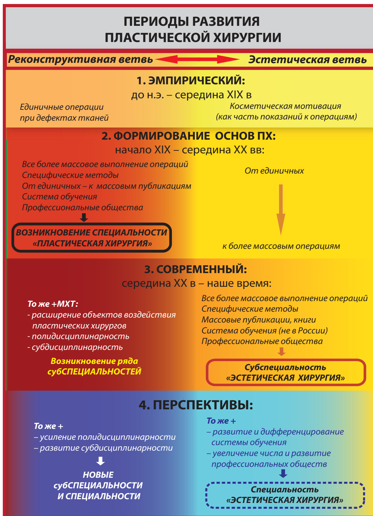
Рис. 1. Периоды развития двух ветвей пластической хирургии: МХТ – микрохирургическая техника